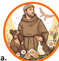
Beato Carlo Acutis

Precio TOTAL p/p: $4,687.00 en doble o triple Mín. 40 pasajeros, Máx. 48